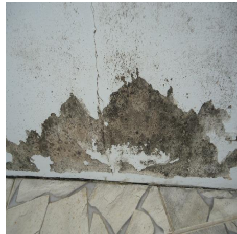
Figura 2 – Manifestação patológica