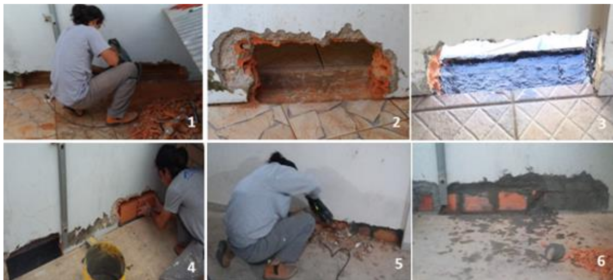
Figura 6 – Passo 1, 2, 3 e 4

Na figura 6 é apresentado o passo a passo de 1 a 6 desse método de recuperação e na figura 7 os passos de 7 a 9, descritos na tabela 4.