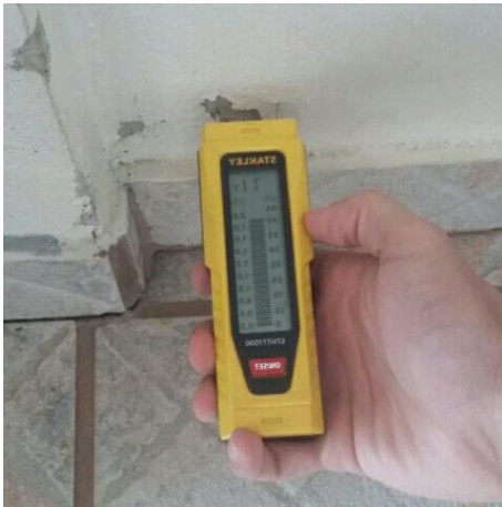
Figura 1 – Medidor de umidade

A estimativa inicial de umidade ascendente encontrada foi de 1,90 linhas, como pode ser visto na figura 01. Além disso, foram detectadas manchas de mofo, bolores e desagregação do revestimento e pintura, apresentado na figura 02.