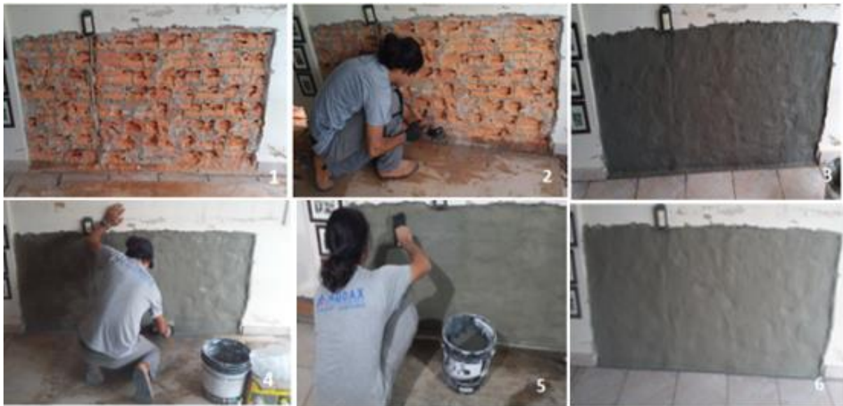
Figura 3 – Passo 1, 2, 3, 4, 5 e 6