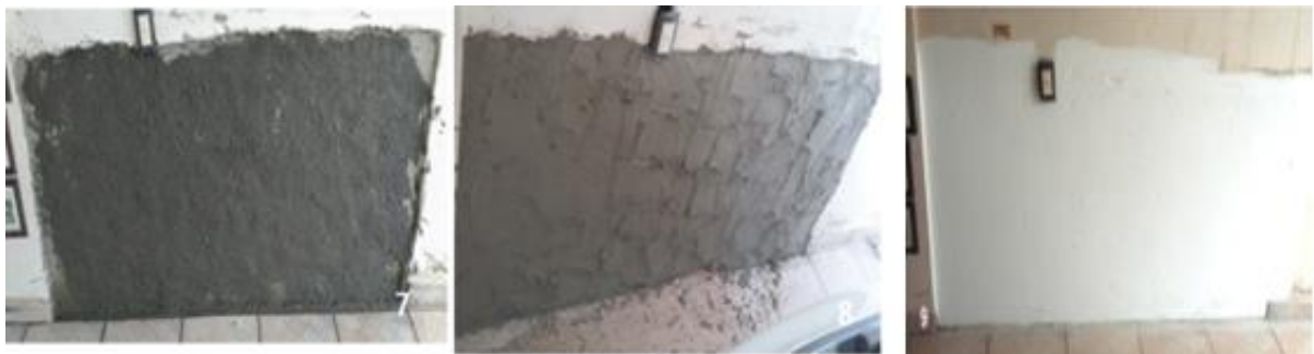
Figura 4 – Passo 7,8 e 9