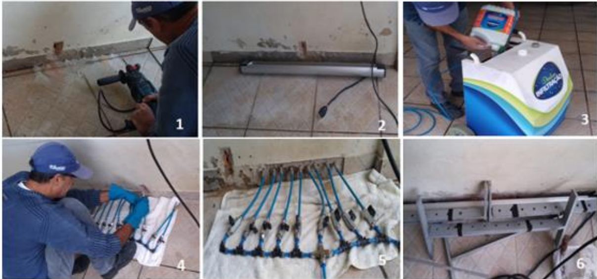
Figura 5 – Passo 1, 2, 3, 4, 5 e 6