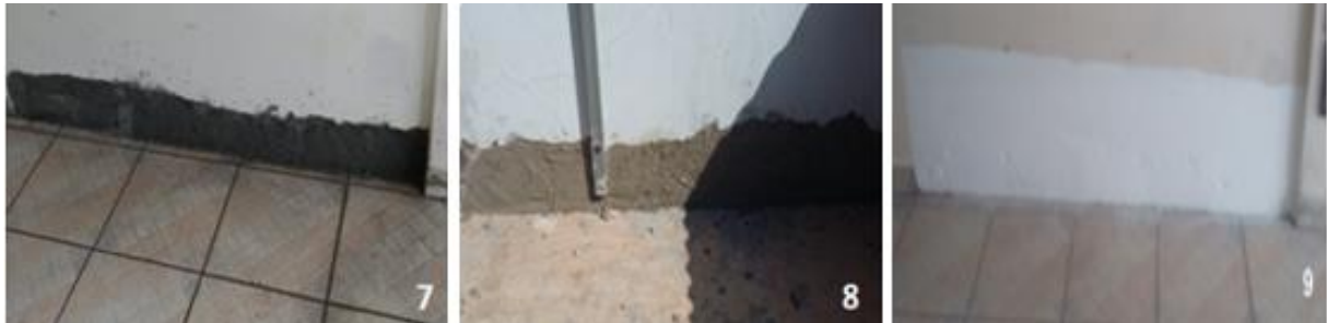
Figura 7 – Passo 5, 6,7e 8