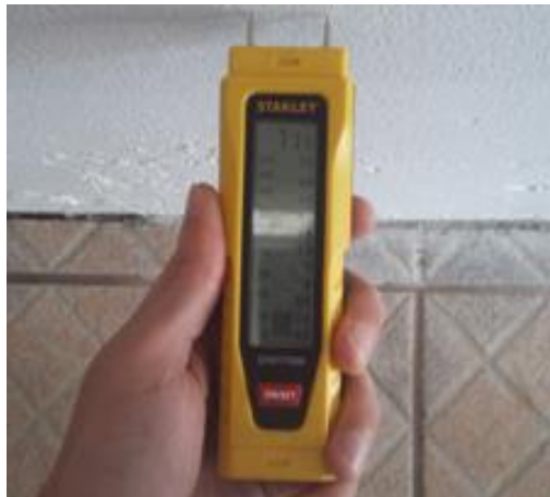
Figura 8 – Medição de umidade ascendente.

Por fim, após três meses das recuperações executadas, realizo-se uma nova medição de umidade, para obter uma referência de como estaria a umidade ascendente na parede. Como pode ser visto na figura 8, o referencial de umidade ascendente foi de 0,5.